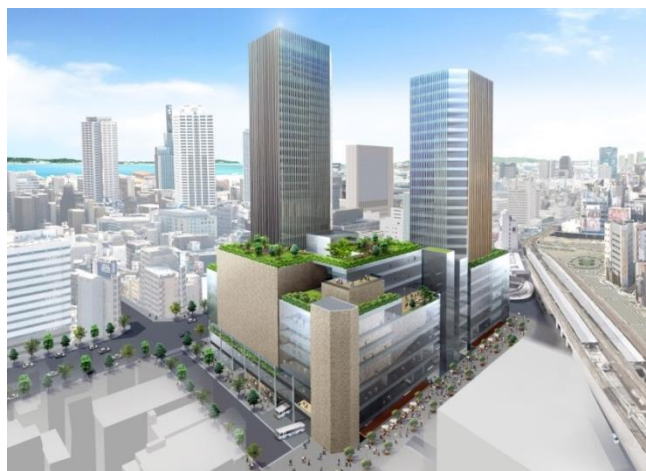
周辺エリアを含めた将来的なイメージ（北東から）

今後、再開発会社との間で基本協定を締結し、再開発会社の運営支援や都市計画提案など市街地再開発事業としての事業化の推進をサポートしてまいります。