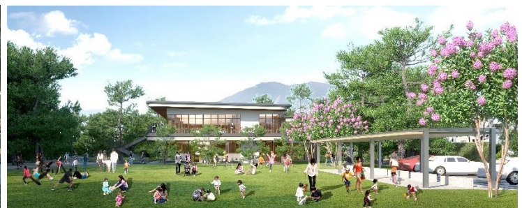
再整備後イメージ